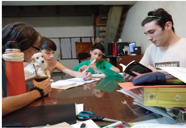
Las familias abren sus puertas al colegio